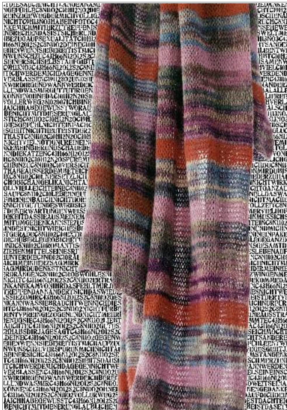
Jens Bennewitz „deine kindlichen hände“, 2008, ed. 3+1 mischtechnik, stempelfarbe und ink-jet auf photopapier, acryl 70 x 100 cm 490,- € / serie zu 5 motiven 2.300,- € (special price für ed.1)