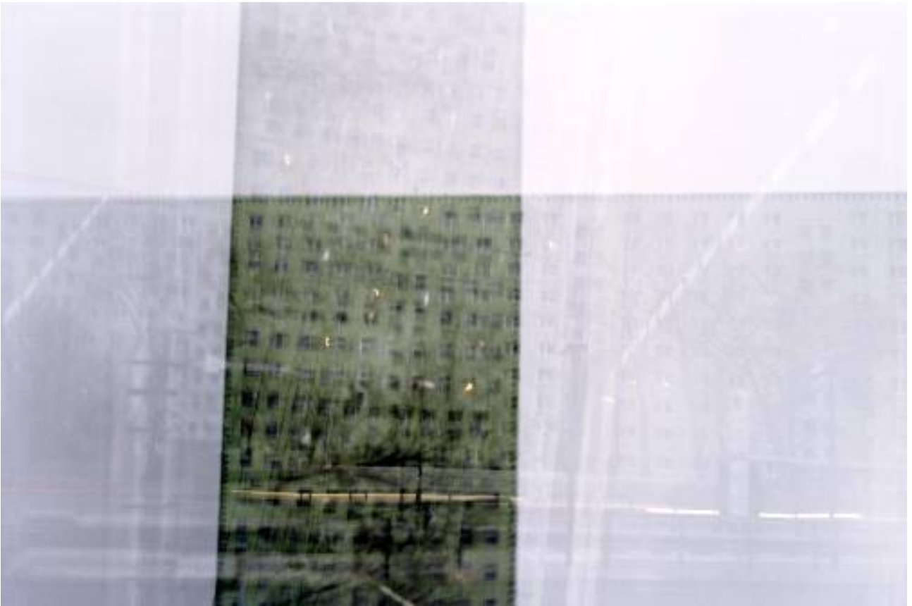
Quadrage: Landsberger Allee, 2004 Tintenstrahl Druck auf Alu-dibond, 71 x 111 cm (Ed. 6+1) 900,00 €