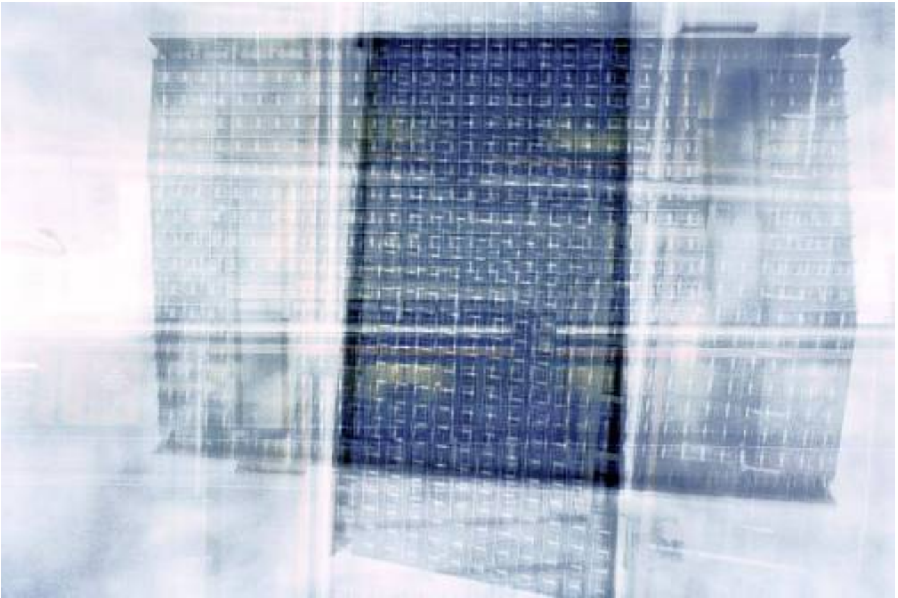
Jens Bennewitz, Quadrage: Rathaus Mitte, 2005 Tintenstrahldruck auf Alu-dibond, 71 x 111 cm (Ed. 6+1) 900,- €