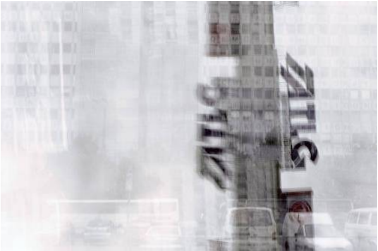
Quadrage: Haus der Elektroindustrie, 2005 Tintenstrahl Druck auf Alu-dibond, 71 x 111 cm (Ed. 6+1) 900,00 €