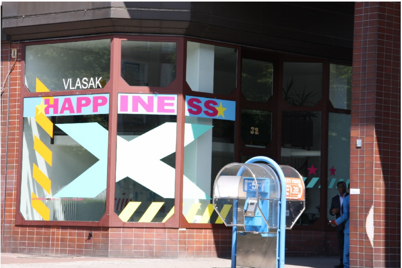
roger frank, happiness x, 2009 , site-specific art piece, plotterschrift, acrylfarbe, papier, offsetdrucke, maße ca. 15 x 4 x 4 m, 1.450,- € beinhaltet „the X“, „king pop“ und „happy clouds“ (zzgl. produktions- und installationskosten)