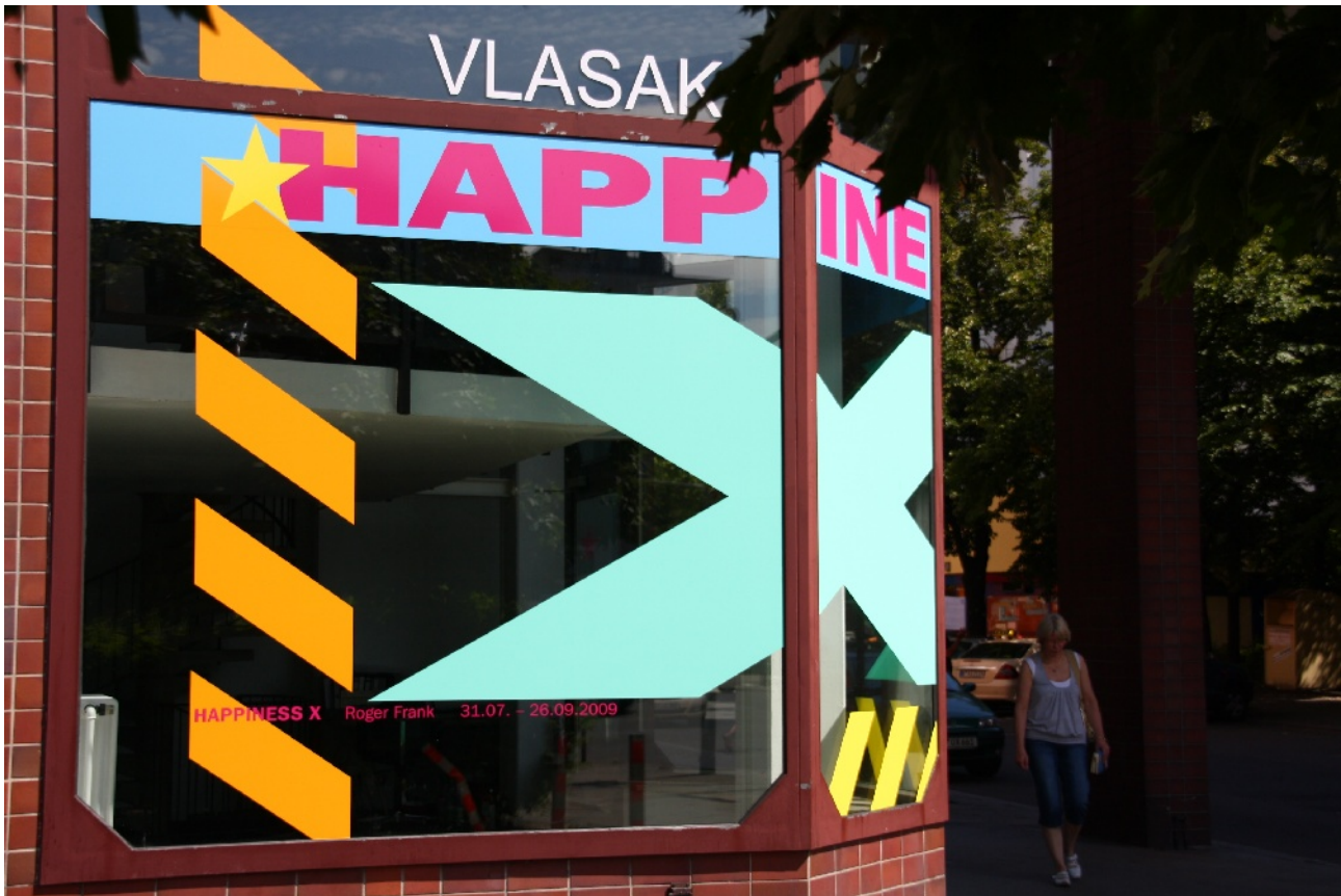
roger frank, the x, 2009 , plotterschrift, maße ca. 15 x 4 m, 950,- € (zzgl. produktions- und installationskosten)