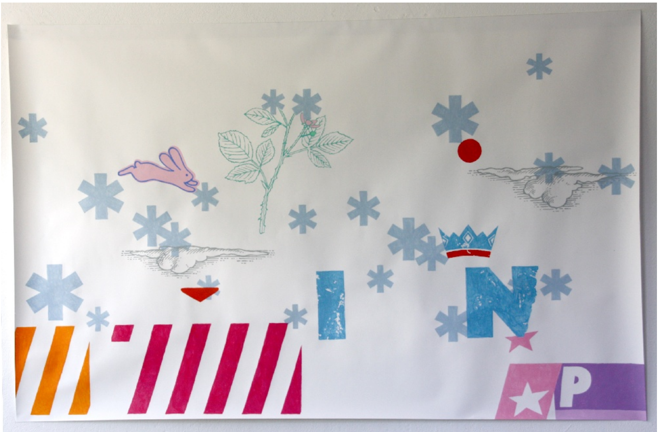
roger frank, king pop, 2009, acrylfarbe, papier, maÙe ca. 150 x 250 cm, 690,- €